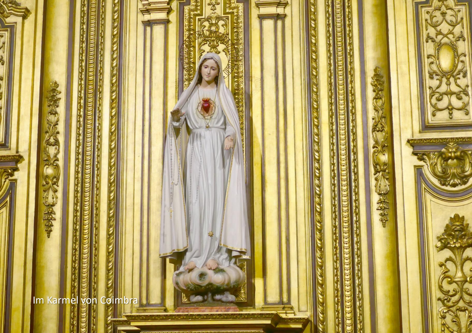
Im Karmel von Coimbra