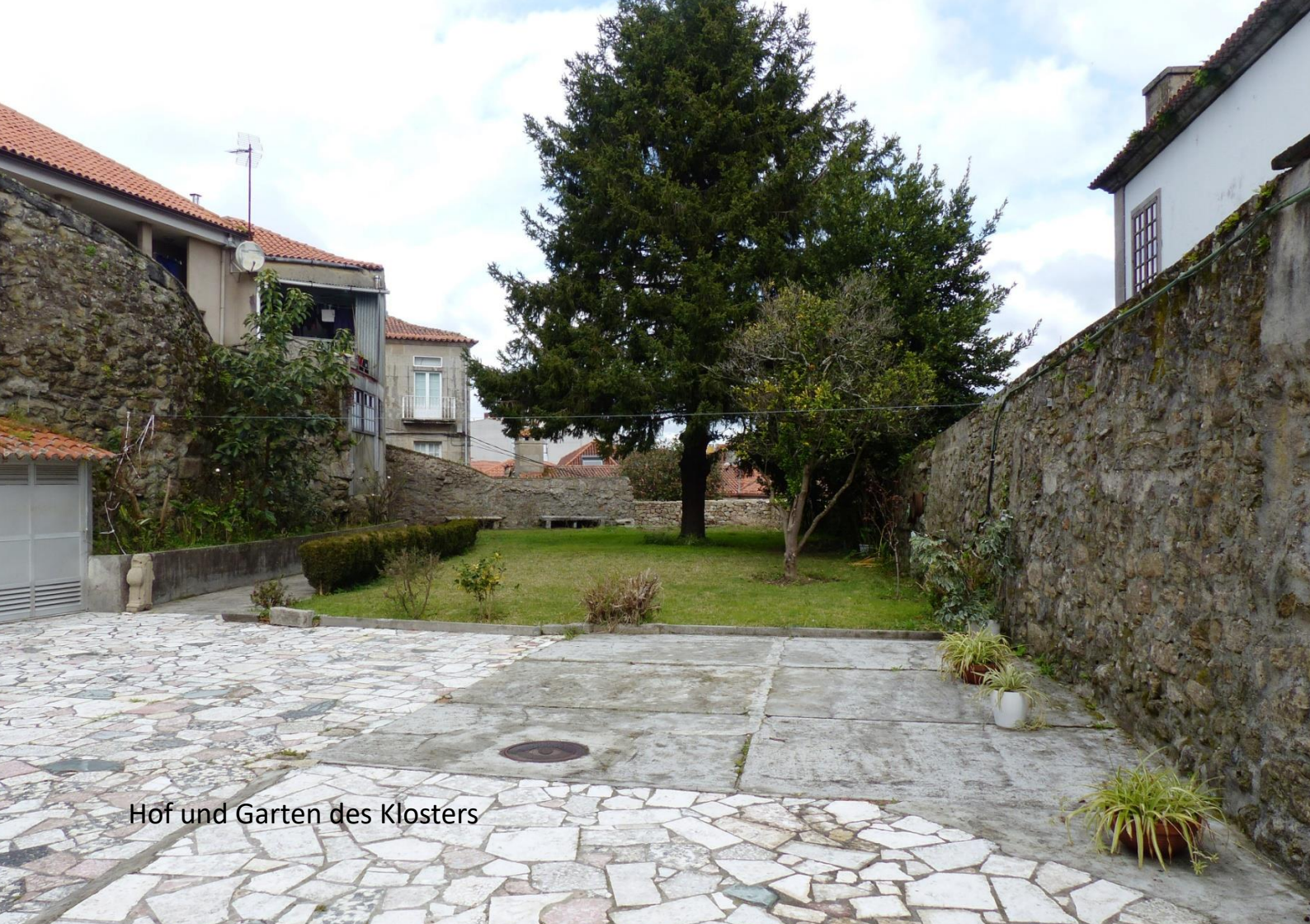
Hof und Garten des Klosters