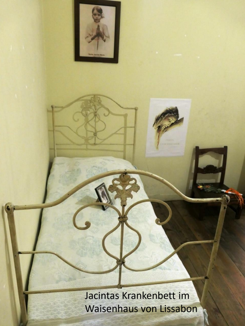
Jacintas Krankenbett im Waisenhaus von Lissabon