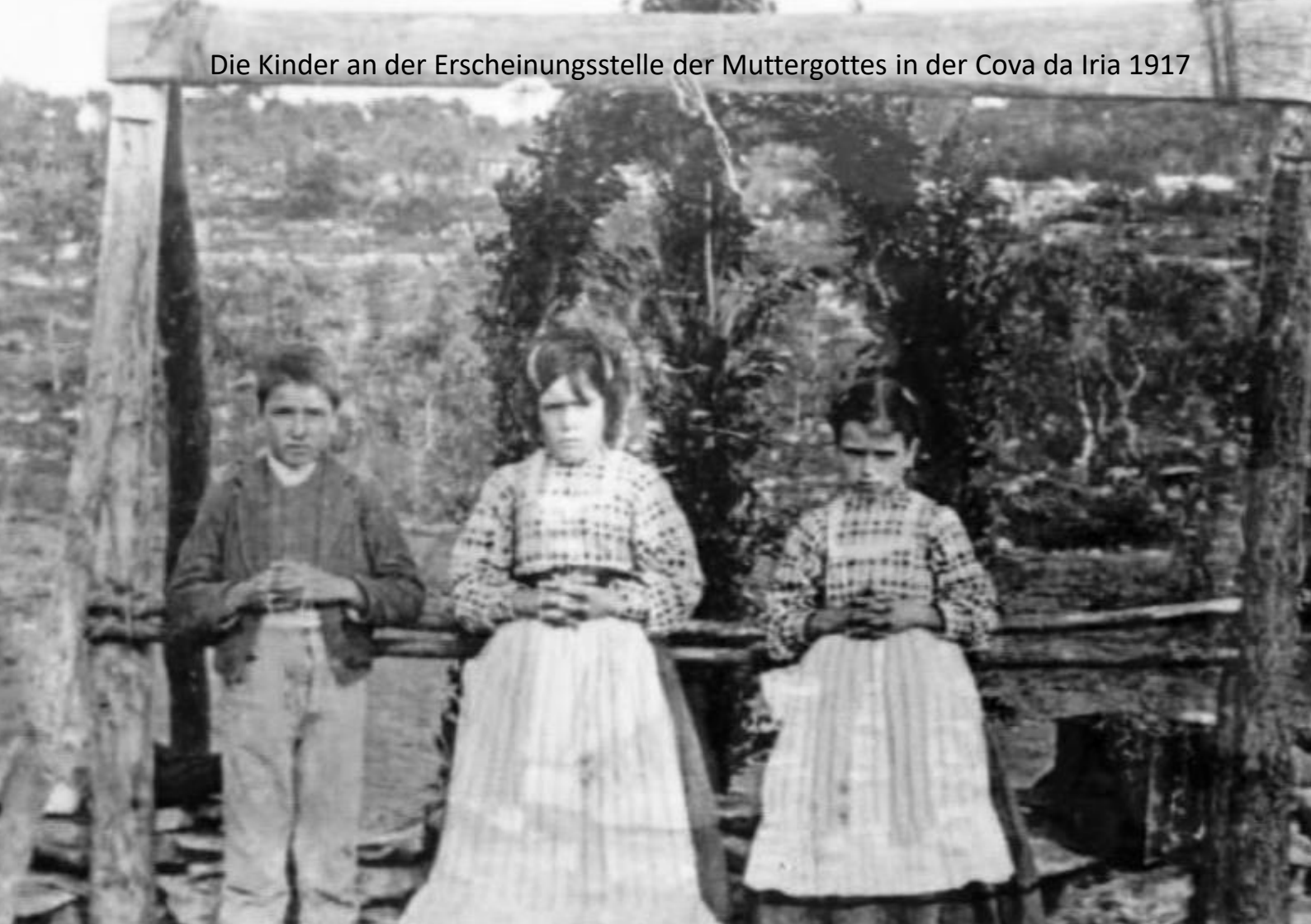
Die Kinder an der Erscheinungsstelle der Muttergottes in der Cova da Iria 1917