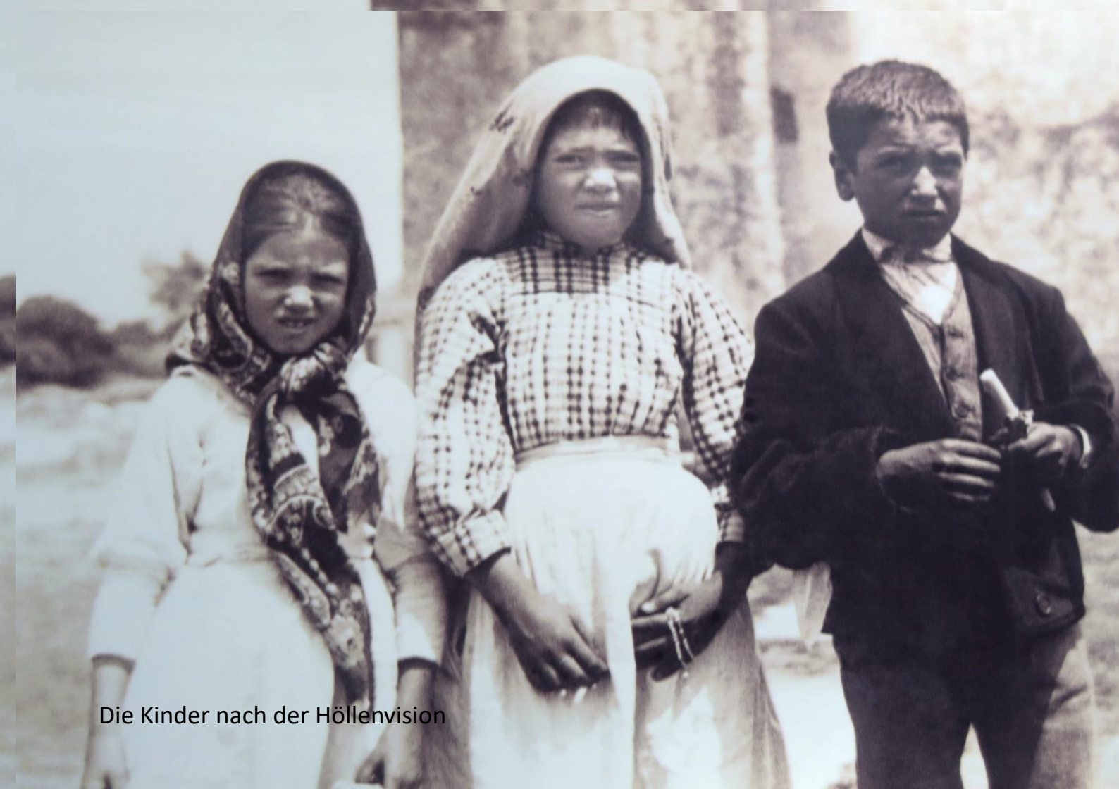
Die Kinder nach der Höllenvision