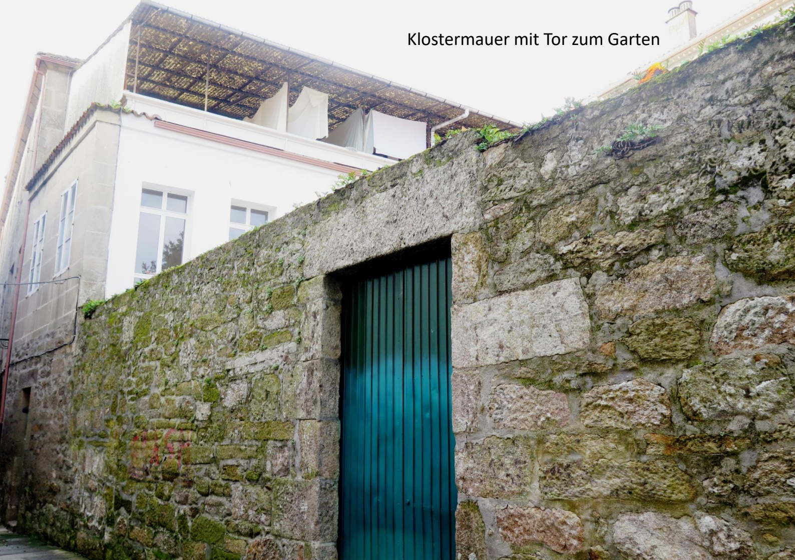
Klostermauer mit Tor zum Garten